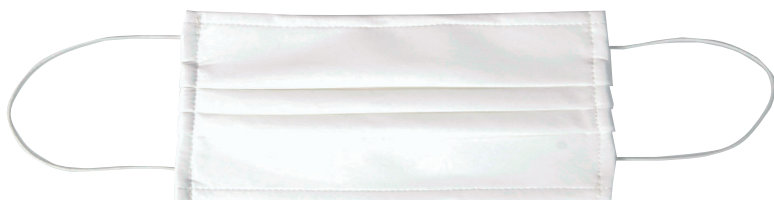
MÁSCARA REUTILIZÁVEL TECIDO (LAVÁVEL)