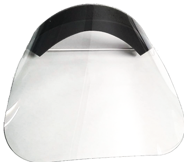
VISEIRA PROTECAO FACIAL 24 CM C/ELÁSTICO EM POLICARBONATO