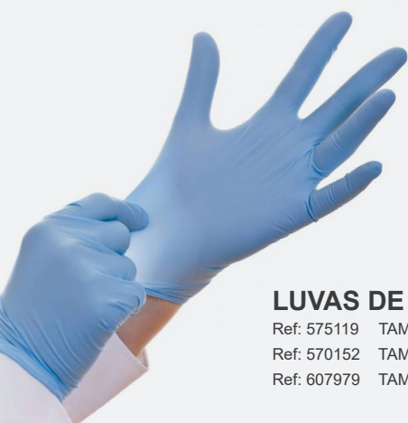
LUVAS DE NITRILO AZUL S/PÓ